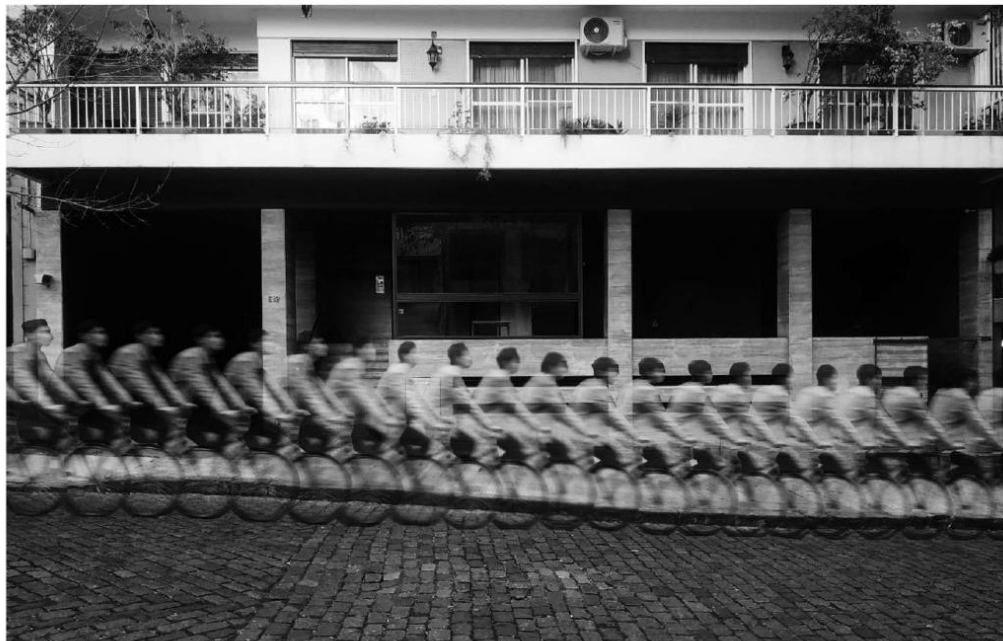
Partiendo. Augusto Foglia. Fotocomposición, Taller Arte y Ciudad 2021.

Es fundamental comprender el juego como una manera de cartografiar el espacio y crear efímeras relaciones con el territorio. La esencia del carácter lúdico y la resignificación como fenómeno cultural es explicada por el filósofo Johan Huizinga (2002) en Homo ludens , por la función social que le encuentra sentido a la experiencia situada. La ciudad se identifica como un sistema social complejo de convivencias con ritmos, actividades, reglas, acuerdos y códigos. Es notable que la noción del juego impregne las relaciones humanas con un orden tan sofisticado, que sitúa lo lúdico dentro del campo estético y urbano de la cotidianeidad.