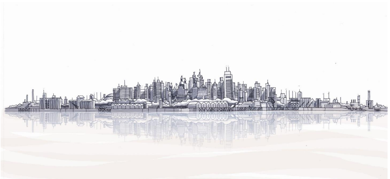
Dibujo del Arq. Luís Lleonart

Para comprender el sentido de una estructura cualquiera siempre es útil conocer las condiciones de partida. Nos referimos al contexto en el que tuvo origen la Facultad de Arquitectura, Planeamiento y Diseño.