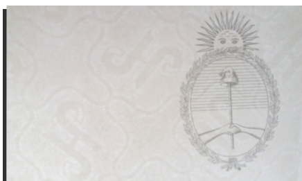
Imagen holográfica tridimensional de alta seguridad, aplicada con la silueta del emblema UNR.